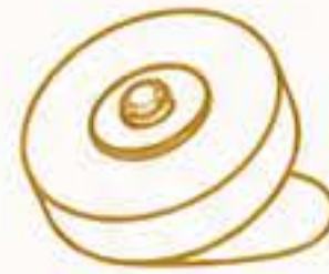
полировка войлочным кругом